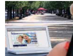
Visione nitida a distanza intermedia e da lontano