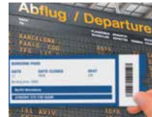
Visione sfocata da vicino (area di lettura)