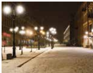
Visione con lente intraoculare sferica

In condizioni di scarsa luminosità, le tradizionali lenti «sferiche» portano ad anomalie visive. I contrasti potrebbero essere scarsamente percepiti e la qualità visiva essere ridotta. Le lenti asferiche riducono queste aberrazioni e permettono una visione migliore ad elevato contrasto. Questo rappresenta un grande vantaggio, particolarmente, ad esempio, in caso di guida notturna.