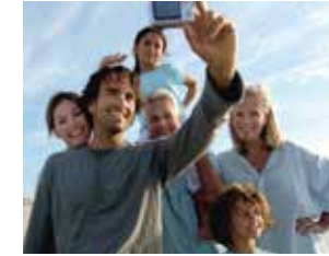
Visione con correzione dell'astigmatismo