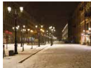
Visione con lente intraoculare asferica