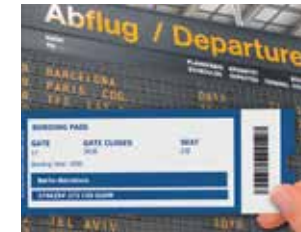
Visione nitida da vicino e da lontano