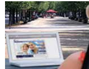
Visione sfocata a distanza intermedia (circa 70 cm)