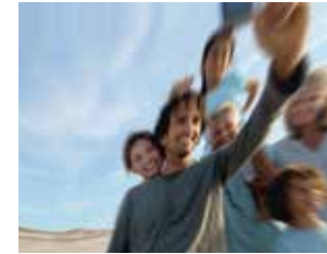
Visione con astigmatismo non corretto

Dopo un esame concordato, l'oculista deciderà con lei se le lenti multifocali sono appropriate.